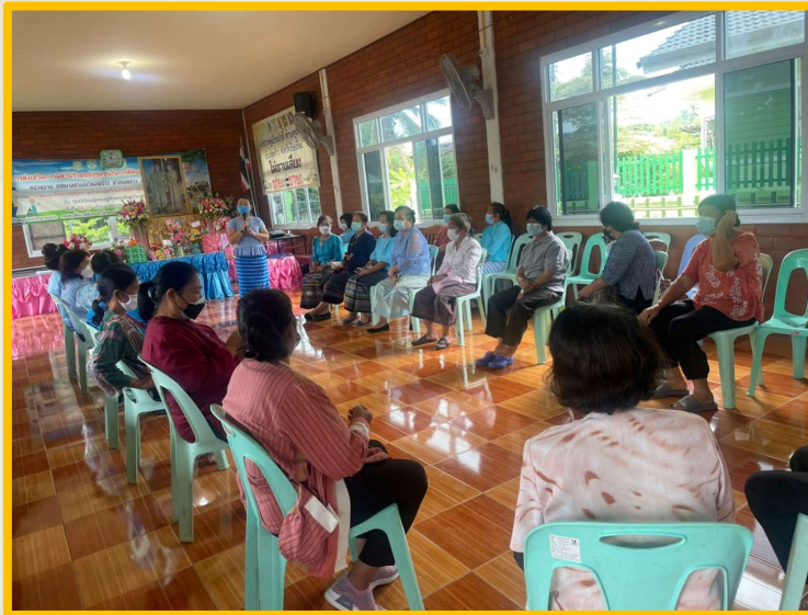
โครงการพัฒนาผลิตภัณฑ์ชุมชน