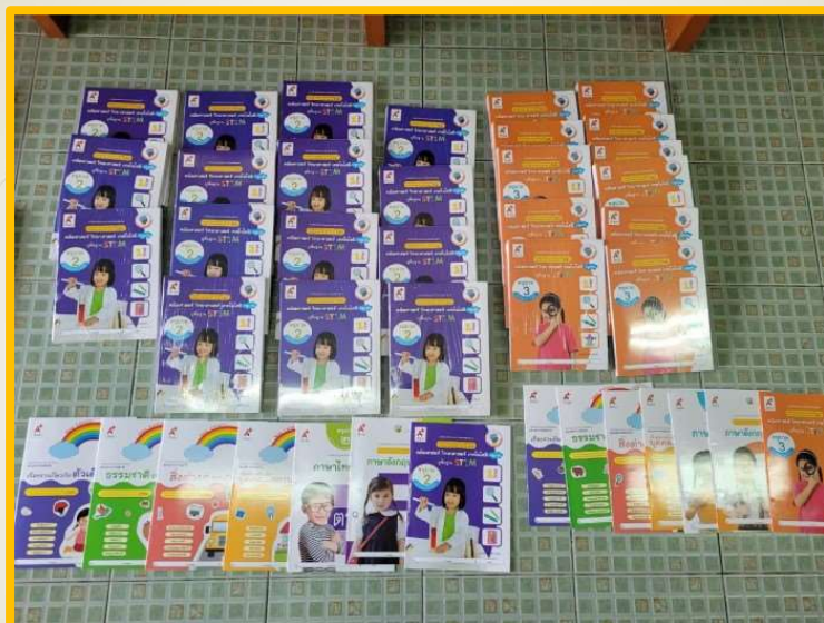
โครงการสนับสนุนค่าใช้จ่ายในการบริหารสถานศึกษา