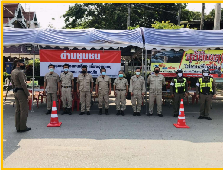
โครงการป้องกันและลดอุบัติเหตุทางถนนช่วงเทศกาลสำคัญ