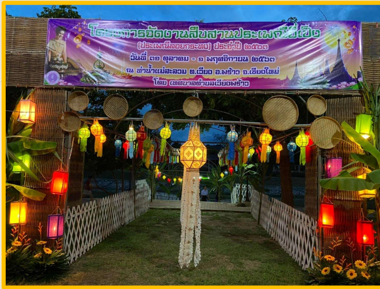
โครงการจัดงานสืบสานประเพณียี่เป็ง (ประเพณีลอยกระทง)