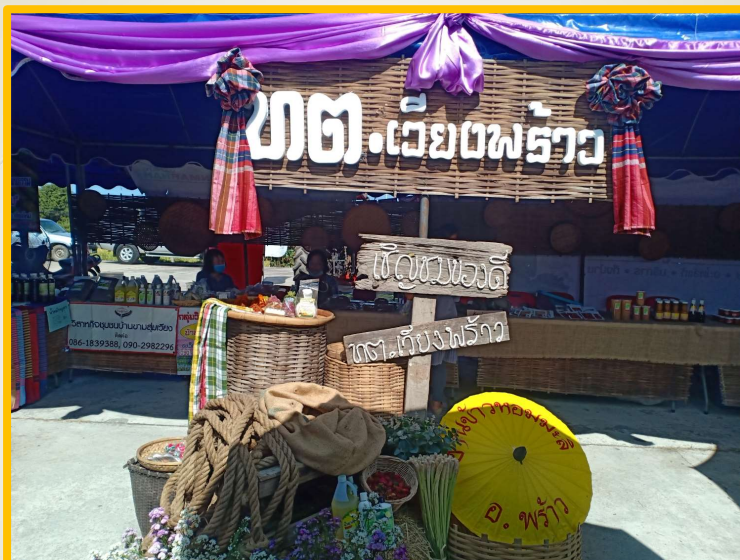
โครงการจัดนิทรรศการและแสดงสินค้าผลิตภัณฑ์ชุมชน