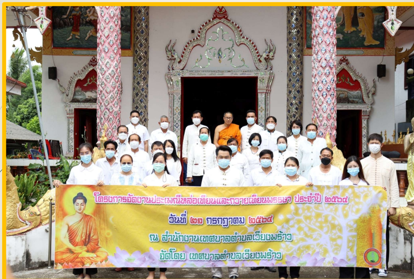
โครงการจัดงานประเพณีห่อเทียนและถวายเทียนพรรษา