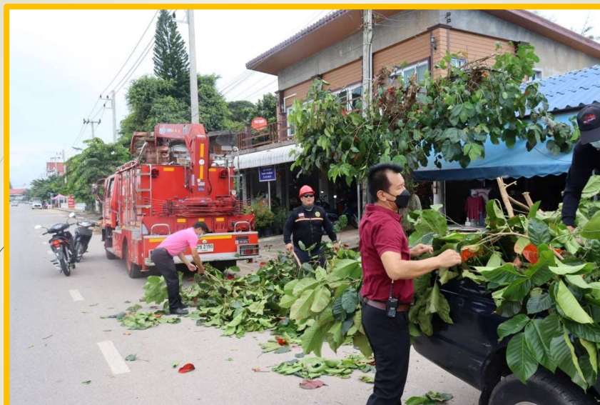
โครงการปรับปรุงภูมิทัศน์ในเขตเทศบาล