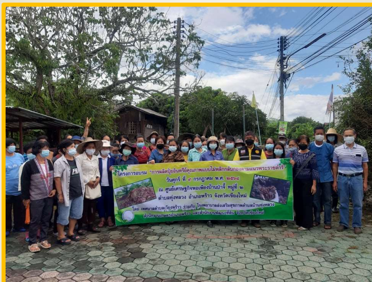
โครงการส่งเสริมการประกอบอาชีพของราษฎรตามแนวทางเศรษฐกิจพอเพียง