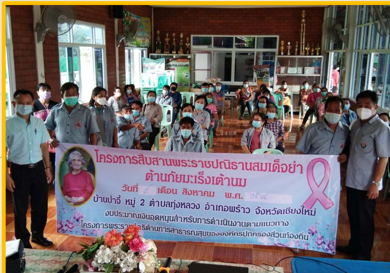
เงินอุดหนุนสำหรับการดำเนินงานตามโครงการพระราชดำริด้านสาธารณสุข