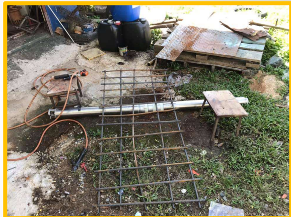
ค่าบำรุงรักษาและปรับปรุงที่ดินและสิ่งก่อสร้าง