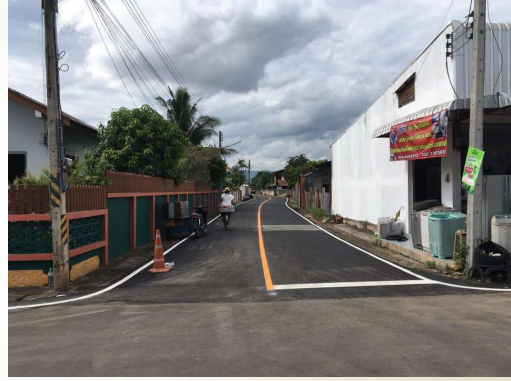
โครงการปรับปรุงถนน สายบ้านช่างคำ - บ้านขามส้ม