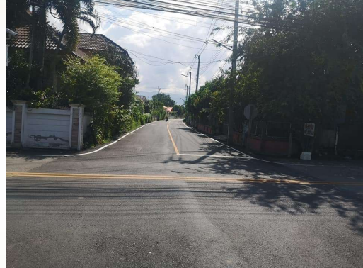
โครงการปรับปรุงถนน สายบ้านป่าเลี้ยว - บ้านขามส้ม