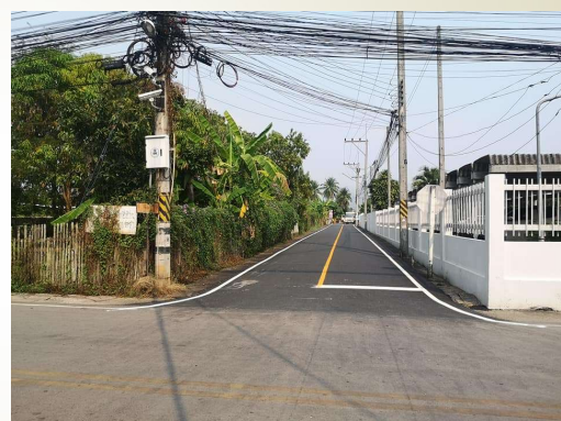
โครงการปรับปรุงถนน สายบ้านแจ่งกู่เรือ - บ้านช่างคำ