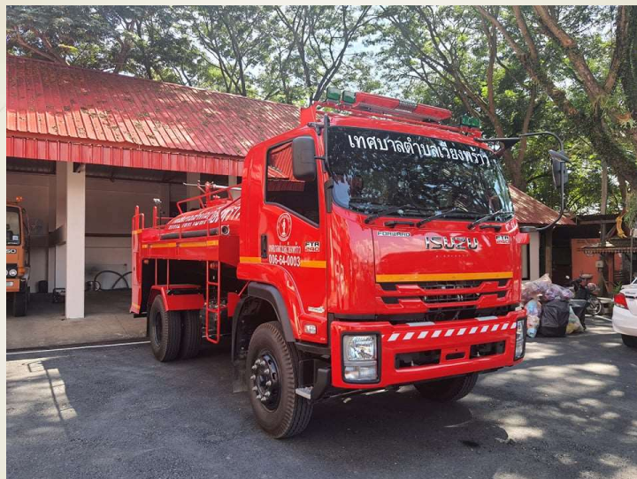
โครงการจัดซื้อรถบรรทุกน้ำ ขนาด 6 ตัน