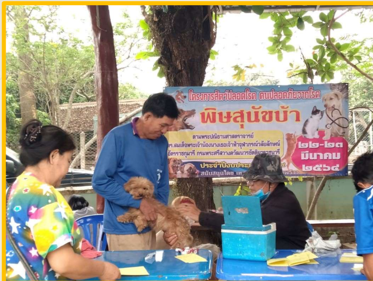
โครงการสัตว์ปลอดโรค คนปลอดภัย จากโรคพิษสุนัขบ้า ตามพระปณิธานศาสตราจารย์ ดร.สมเด็จเจ้าฟ้าฯ กรมพระศรีสวางควัฒนวิเชษฐวรมณี ประจำปีงบประมาณ ๒๕๖๕ สนับสนุนโดย กศน.บุรีรัมย์