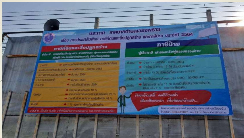
โครงการเพิ่มประสิทธิภาพการจัดเก็บภาษี (บริการรับชำระภาษีนอกเวลาราชการ)