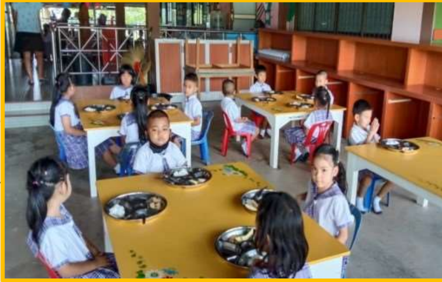
โครงการอาหารกลางวันให้นักเรียน