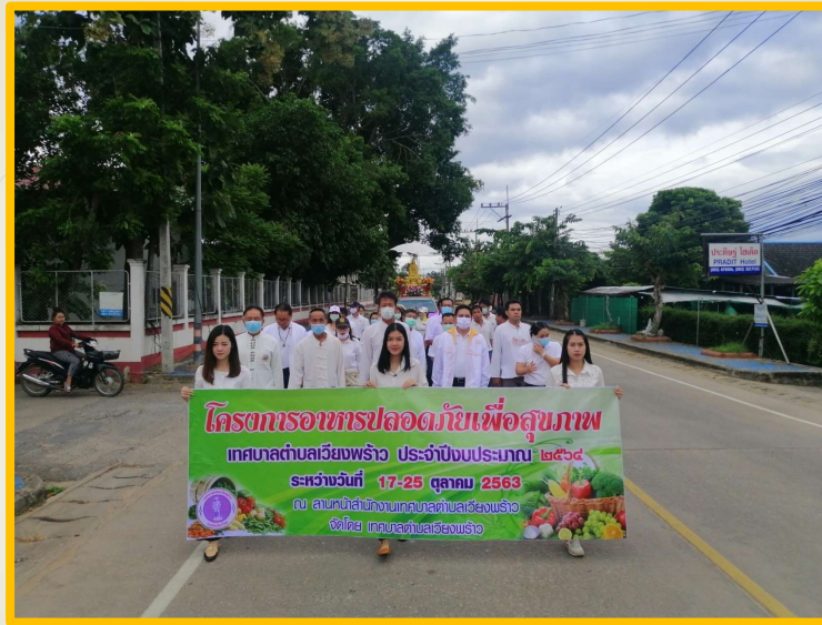
โครงการอาหารปลอดภัยเพื่อสุขภาพ เทศบาลตำบลเวียงพราญ