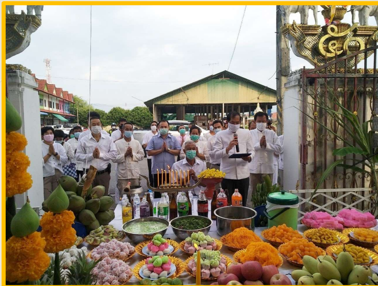
โครงการส่งเสริมวัฒนธรรมท้องถิ่นใส่ขันดอกบูชาอินทขิล (เสาหลักเมืองพริ้ว)