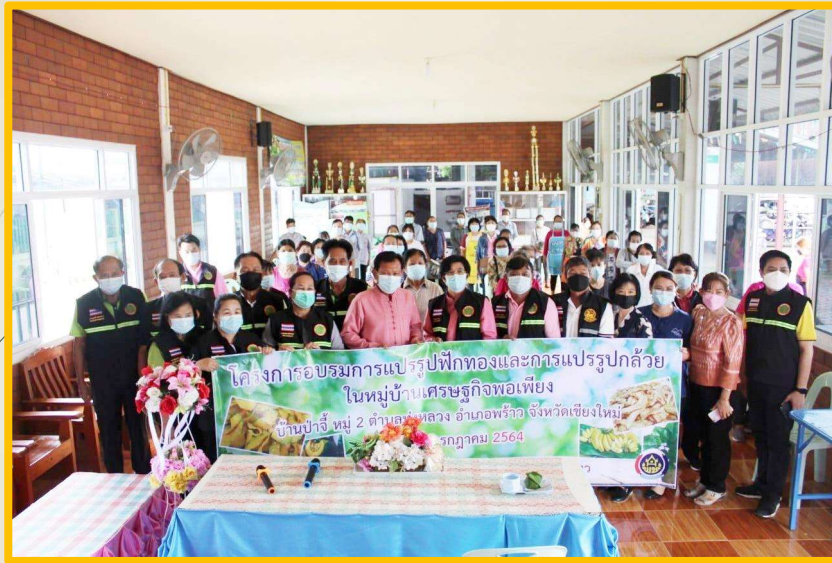
โครงการส่งเสริมการพัฒนาสตรีและพัฒนาครอบครัว