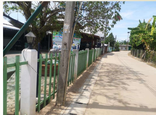
โครงการก่อสร้างรางระบายน้ำ ซอย 1 บ้านป่าจี่