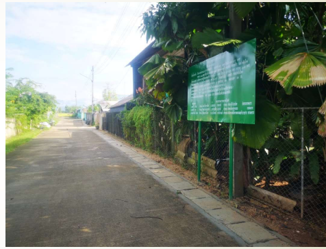
โครงการก่อสร้างระบายน้ำ บ้านนางจันทร์ฟอง มูลห้วย บ้านขามส้ม