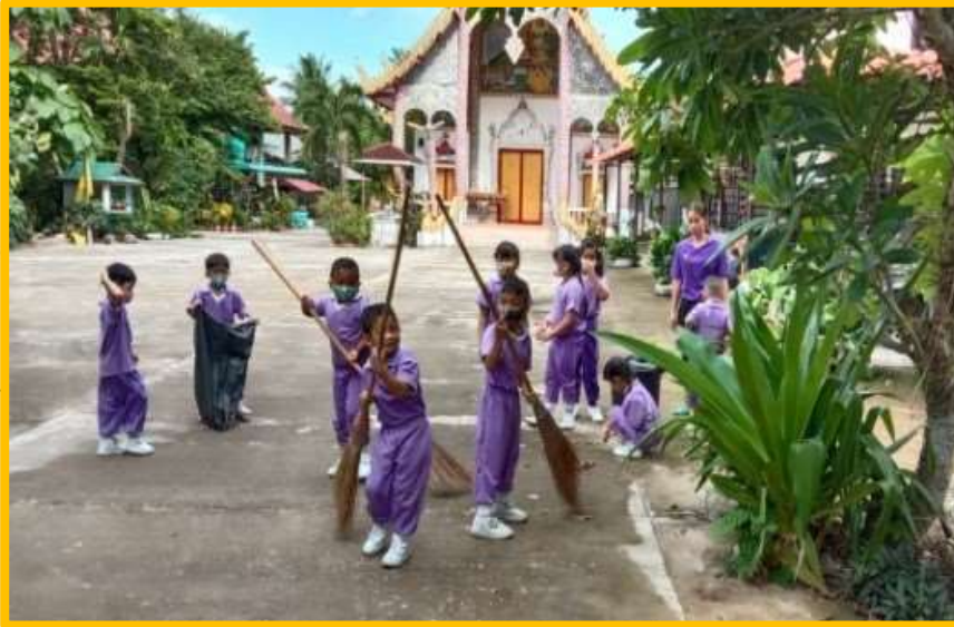
โครงการจัดกิจกรรมเพื่อพัฒนาการเรียนการสอน