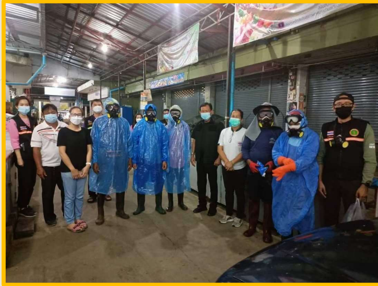
โครงการป้องกันโรคติดต่อและไม่ติดต่อ