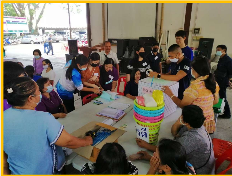
ค่าใช้จ่ายในการเลือกตั้ง