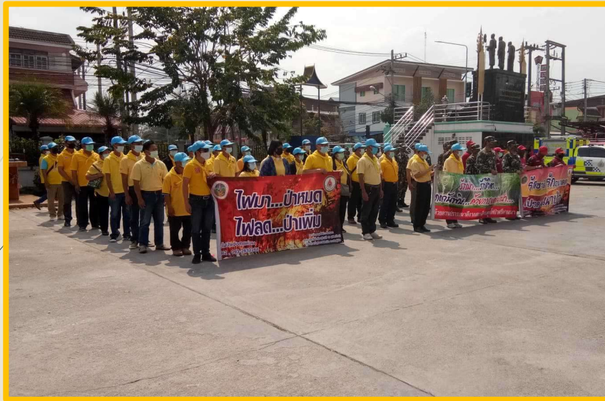
โครงการแก้ไขปัญหามลภาวะเป็นพิษ